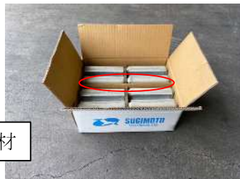
DVG1510 ブロック × 4個入り